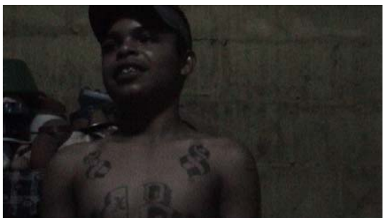
Pandilleros de la Barrio 18 de Tapachula (México)